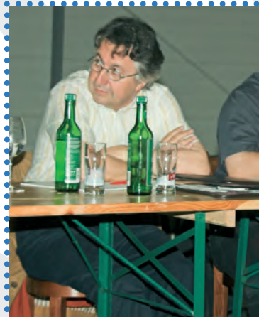
GV . 2008